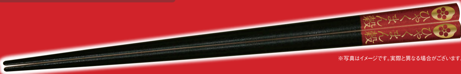
※写真はイメージです。実際と異なる場合がございます。