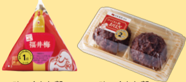
ひやくまん穀おにぎり ひやくまん穀おはぎ